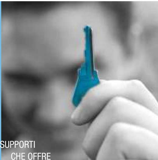
...DAI SUPPORTI CHE OFFRE

Consulman propone metodi di lavoro caratterizzati da: